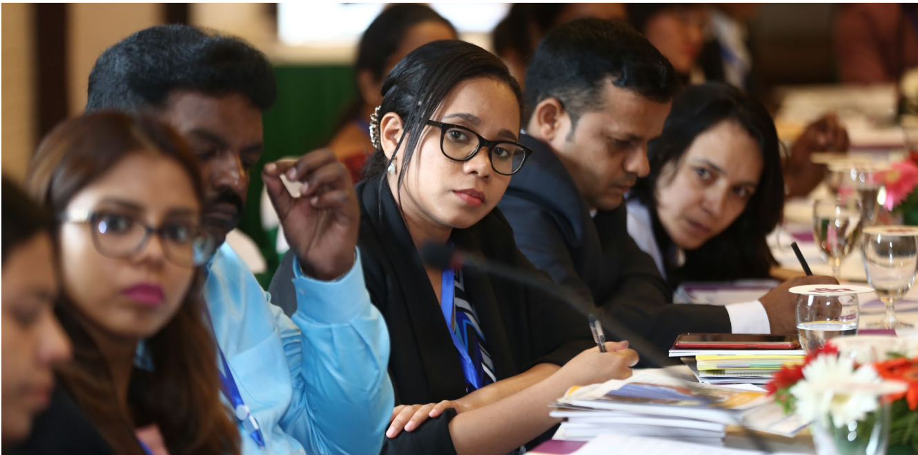
Participants à l'atelier régional de formation de l'echi pour l'Asie et le Pacifique, Katmandou, Juillet 2019