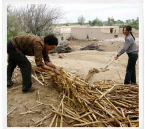
Des villageois tentent d'entraver l'avancée des dunes de sable en utilisant de la paille dans le village de Waixi dans le comté de Minqin, dans la province du Gansu au nord-ouest de la Chine (juillet 2007)

En guise de réponse, la Chine a, au cours des cinq dernières années, inondé le problème avec de l'argent, dépensant plus de US$7 milliards pour planter des milliards d'arbres et protéger les pâturages. Mais les déserts continuent d'avancer d'environ 2500 km 2 par an, selon les chiffres officiels, et des milliers de villages ont dû être abandonnés devant l'avancée des dunes. Les causes du problème ne sont pas claires,