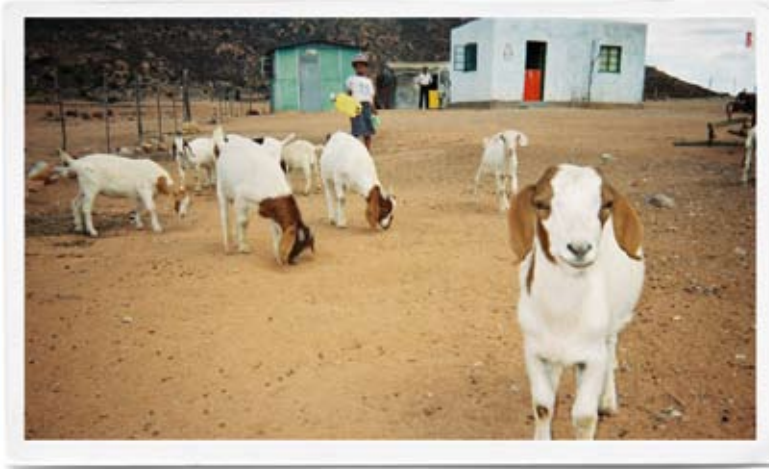
Situé dans les hauts-plateaux rocheux à côté d'anciennes terres en jachère, cet endroit est typique de nombreux camps de bétail établis depuis longtemps dans l'ancienne zone de "réserve" de Leliefontein