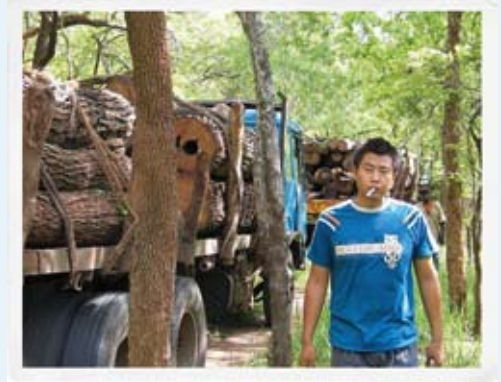
Un camion chinois achemine du bois issu du Parc national des Quirimbas (province de Cabo Delgado, Mozambique)

Cette réaction révèle l'alliance douteuse qui émerge entre des exploitants forestiers corrompus et des fonctionnaires ou des politiciens véreux. Si les lois étaient appliquées correctement, si la pauvreté n'était pas si extrême et si la richesse et le pouvoir étaient