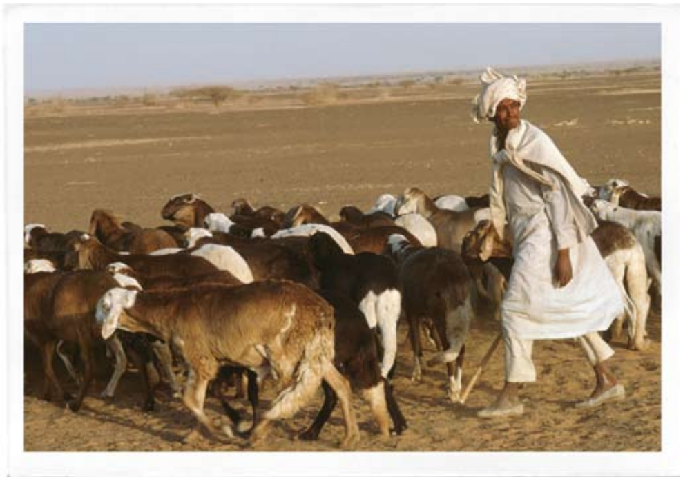
Un éleveur emmène ses bêtes au pâturage, dans la province du Kordofan au Soudan

Les agents des Nations Unies affirment que plus de 600 personnes ont trouvé la mort dans des affrontements interethniques cette année et que la situation est une véritable poudrière tant que les accords de paix ne donnent pas de résultats. Or, les pourparlers qui ont commencé à Sirte, en Libye en octobre dernier, ont été suspendus au bout de deux jours devant le refus de deux chefs rebelles très en vue au Darfour d'y prendre part. L'un d'entre eux, Abdul el-Nur, chef du Mouvement pour la Libération du Soudan, a déclaré qu'il ne rejoindrait la table des négociations qu'une fois que la force onusienne promise pour le maintien de la paix serait en place, car c'est seulement dans ces conditions qu'il serait possible de faire appliquer les conditions de tout accord de paix. Les forces onusiennes devraient prendre leur poste en janvier ; toutefois, à quelques semaines seulement de