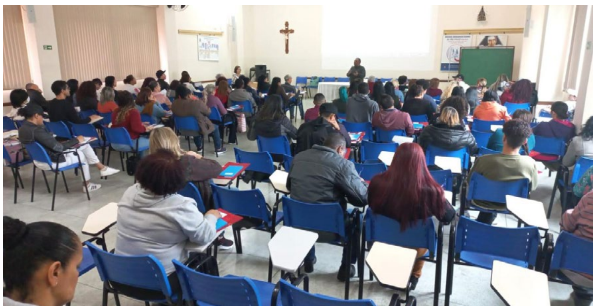
Figura 2: Registro de atividade teórica do curso.

A título de comparação, a taxa de evasão ao longo deste curso foi inferior àquela observada em outros projetos do LabJuta, como o Vídeo Poste.