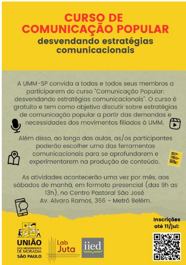
Figura 1: Material de divulgação do curso.