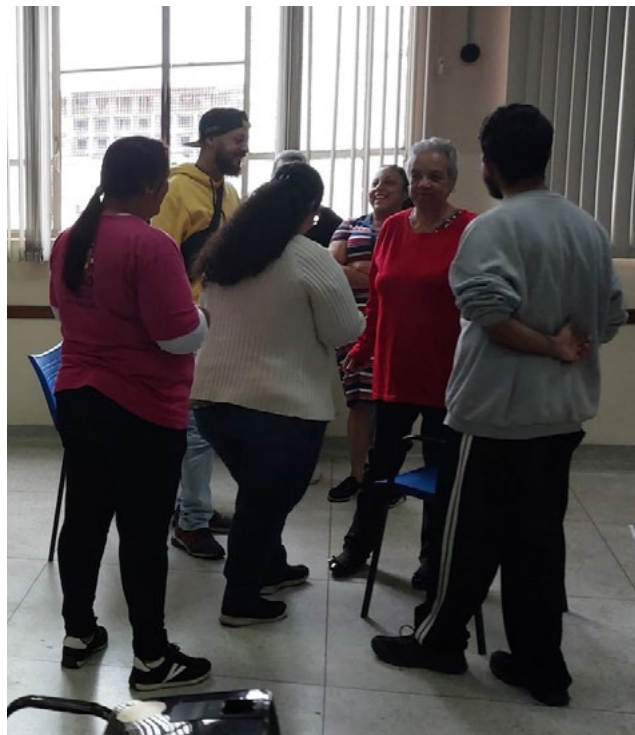
Figura 6: Participantes da oficina de produção de vídeo em preparo para entrevista à uma liderança veterana da UMM-SP.

O vídeo produzido pelo grupo, por exemplo, foi direcionado ao “povo não mobilizado”, com o objetivo de registrar, ilustrar e legitimar a importância da luta por moradia. O material também se dirige aos novos integrantes do movimento, ao demonstrar que, apesar das dificuldades, existem possibilidades concretas de conquista da moradia digna.