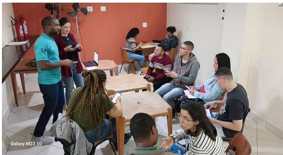
Figura 4: Oficina de produção de textos em atendimento com os facilitadores.

Essa situação remete, direta ou indiretamente, à reflexão sobre o custo dos equipamentos e serviços, e, conseqüentemente, sobre o recorte de classe social que define o acesso à tecnologia. Reforça-se, assim, a necessidade de políticas públicas subsidiadas para a inclusão tecnológica e comunicacional da população de baixa renda em nosso país, incluindo os grupos sem-teto.