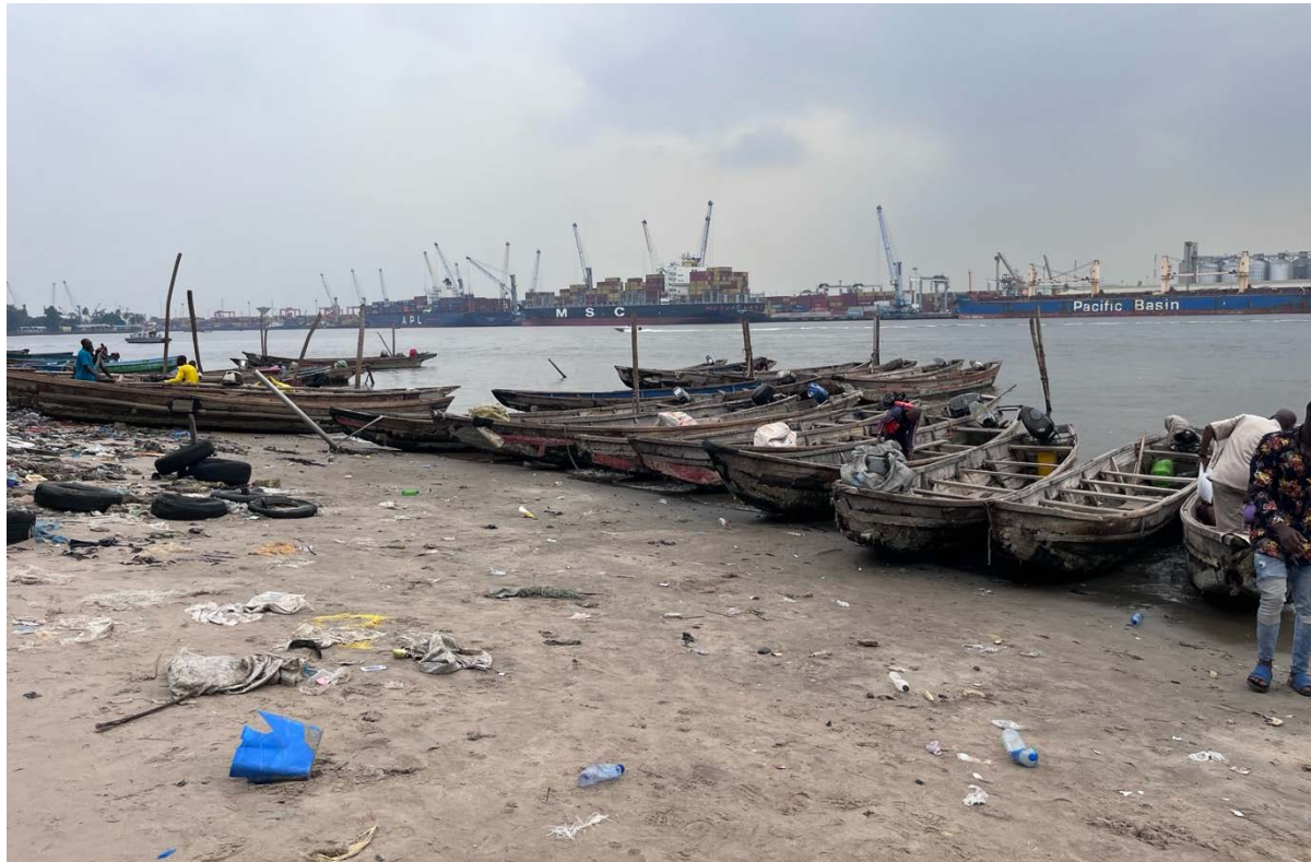
Figura 5. O “cais” em Itun Agan, uma comunidade na orla em frente ao principal porto marítimo de Lagos. Comunidades como essa frequentemente são contrapostas ao transporte comercial e interesses do estado nas hidrovias

De acordo com um pesquisador local entrevistado para este estudo, os ingredientes que historicamente se combinaram para informar quais comunidades chamam a atenção do governo para o despejo são previsíveis: terras de alto valor em uma localização privilegiada ocupada por inquilinos e posseiros de baixa renda; projetos do setor privado para lucrar com as acomodações de luxo que poderiam ser construídas em tais terras; e um forte desejo do governo estadual de “modernizar” a imagem da cidade. 9 As apostas são ainda maiores para todas as partes envolvidas quando