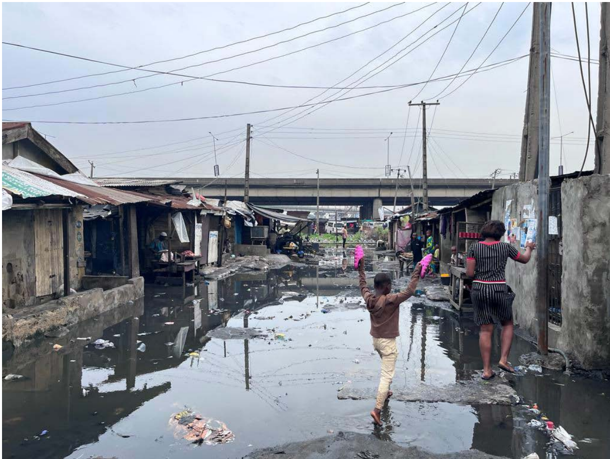
Figura 4. Vista de rua de Otumara, um assentamento informal considerado pelos agentes da sociedade civil como estando em risco de despejo iminente devido a um exercício de renovação planejado pelo governo estadual